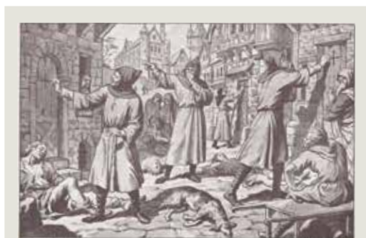
Figure 3. Peste de Rouen (1522). Les maisons contaminées sont marquées d'une croix. Le geste des soldats/miliciens portant la main au nez "pour éviter les effluves de la contagion" sera repris dans le tableau d'Antoine-Jean Gros (1771-1835) Bonaparte visitant les pestiférés de Jaffa.

Le système des lazarets et des quarantaines fut officiellement abandonné au cours de la seconde moitié du XIX e siècle. En 2017, nous écrivions dans un ouvrage d'histoire postale que le système quarantenaire "restait encore vivace dans l'inconscient collectif" et que l'apparition ou la résurgence de certaines maladies infectieuses serait de nature "à réveiller des ressorts passionnels et des peurs". Début 2020, avec le Covid-19, la résurgence de maladies infectieuses connues n'est pas en cause. Pire, l'apparition d'un "nouveau virus", par conséquent d'une "maladie infectieuse nouvelle", attise la peur et s'associe à des comportements individuels ou collectifs inappropriés. La médecine actuelle semble démunie, mais probablement de façon provisoire, car en peu de temps l'identification du virus et le partage des connaissances sur ses séquences ont permis de mettre en œuvre des travaux multinationaux pour préparer des vaccins. Désormais, la lutte