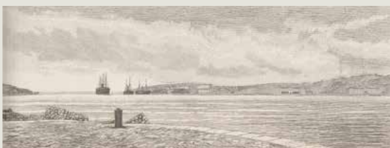
Figure 4. L'hôpital Caroline, réceptionné le 30 juin 1824 (construit par Michel-Robert Penchaud sur l'île de Ratonneau) puis transformé en un grand lazaret (de 1851 à 1887) pour remplacer le lazaret d'Arenc. Vue depuis le port Dieudonné. Le Monde illustré, no 2081, 13 février 1897.

Le système des lazarets et des quarantaines fut officiellement abandonné au cours de la seconde moitié du XIX e siècle. En 2017, nous écrivions dans un ouvrage d'histoire postale que le système quarantenaire "restait encore vivace dans l'inconscient collectif" et que l'apparition ou la résurgence de certaines maladies infectieuses serait de nature "à réveiller des ressorts passionnels et des peurs". Début 2020, avec le Covid-19, la résurgence de maladies infectieuses connues n'est pas en cause. Pire, l'apparition d'un "nouveau virus", par conséquent d'une "maladie infectieuse nouvelle", attise la peur et s'associe à des comportements individuels ou collectifs inappropriés. La médecine actuelle semble démunie, mais probablement de façon provisoire, car en peu de temps l'identification du virus et le partage des connaissances sur ses séquences ont permis de mettre en œuvre des travaux multinationaux pour préparer des vaccins. Désormais, la lutte